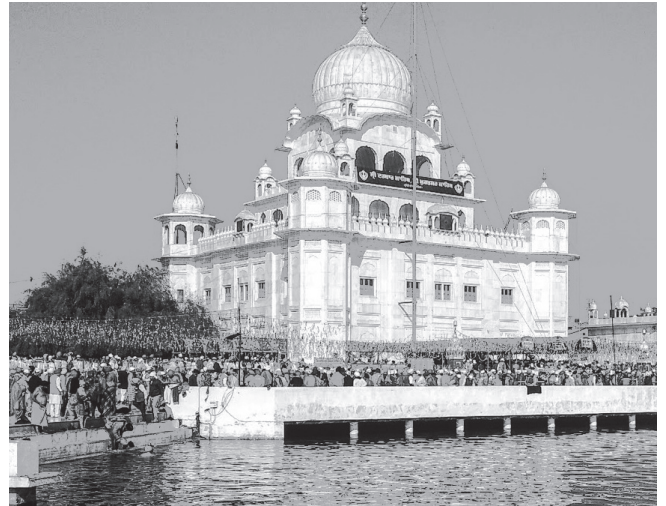
ਗੁਰਦੁਆਰਾ ਟੁੱਟੀ-ਰੀਢੀ ਸਾਹਿਬ, ਸ੍ਰੀ ਮੁਕਤਸਰ